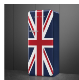
FAB28RDUJ6 Türanschlag: Rechts Sonderedition