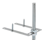
STABMIX Tap stabiliser