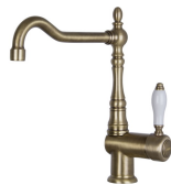
MIR6O-2 Kolor: Mosiądz