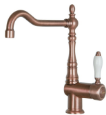
MIR6RA-2 Kolor: Miedź