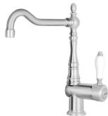
MIR6NS-1 Kolor: Nikiel