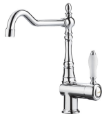
MIR6CR-2 Renk: Krom