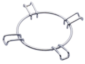
GRW Wok support