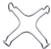
GRM Подставка для кофе, для газовых варочных панелей