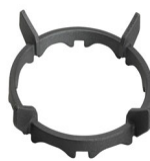
WOKGHU Wokhållare i gjutjärn. Designad för stabilitet och smidighet under tillagning.