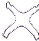
GRM Подставка для кофе, для газовых варочных панелей