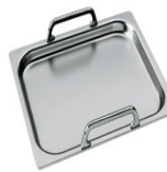
TPK Stainless steel grill plate to cook Teppanyaki dishes