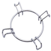
GRW Wok support