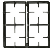
GRC60 Set griglie in ghisa per piani 60 cm