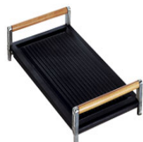
BB3679 Bistecchiera in ghisa