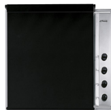
7520NE Coperchio nero per piani cottura 60 cm manopole laterali.