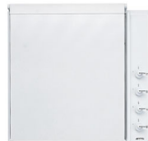
7520EB Coperchio bianco per piani cottura 60 cm manopole laterali.