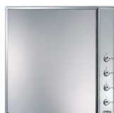
7520X Coperchio vetro per piani cottura 60 cm manopole laterali.