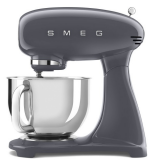
SMF03GREU Slate Grey