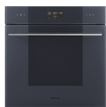
SO6102TG Neptune Grey