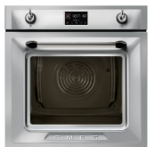
SOP6902S2PX Нержавеющая сталь