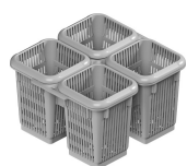
PHOOS04 4 compartments polypropylene basket for cutlery