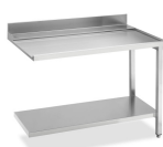
Table de sortie gauche avec dossier 100 mm et tablette inférieure – L x P x H : 1 200 x 720 x 821,5 mm