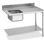
Table d'entrée côté droit avec évier et trou de débarrassage, dossier (100 mm) et tablette inférieure, dim. (LxPxH) 1200 x 720 x 821,5 mm