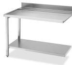
Table d'entrée/sortie universelle réversible avec tablette inférieure – L x P x H : 1 200 x 560 x 821,5 mm