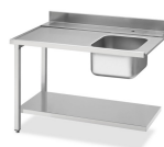
table d'entrée côté droit avec évier, dossier (100 mm) et tablette inférieure, dim. (L x P x H) 1200 x 720 x 821,5 mm