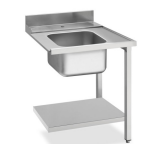
Table d'entrée gauche avec évier, dossier 100 mm et tablette inférieure - L x P x H : 1 200 x 720 x 821,5 mm