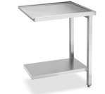
Table de sortie droite avec dossier 100 mm et tablette inférieure - L x P x H : 1 200 x 720 x 821,5 mm