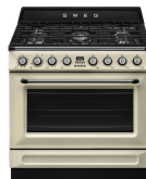
TR90GMP Color: Crema