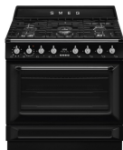
TR90GMBL Color: Negro