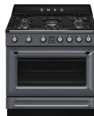
TR90GMGR Color: Gris pizarra