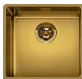
VSTR50BRX Color: Bronce