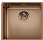
VSTR50CUX Color: Cobre