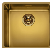
VSTR50BRX Färg: Mässing