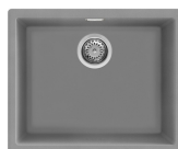
VZP56CT Färg: Cement/Betong