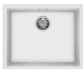
VZP56B Färg: Vit